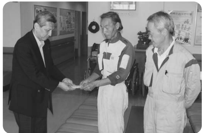
月形花き生産組合