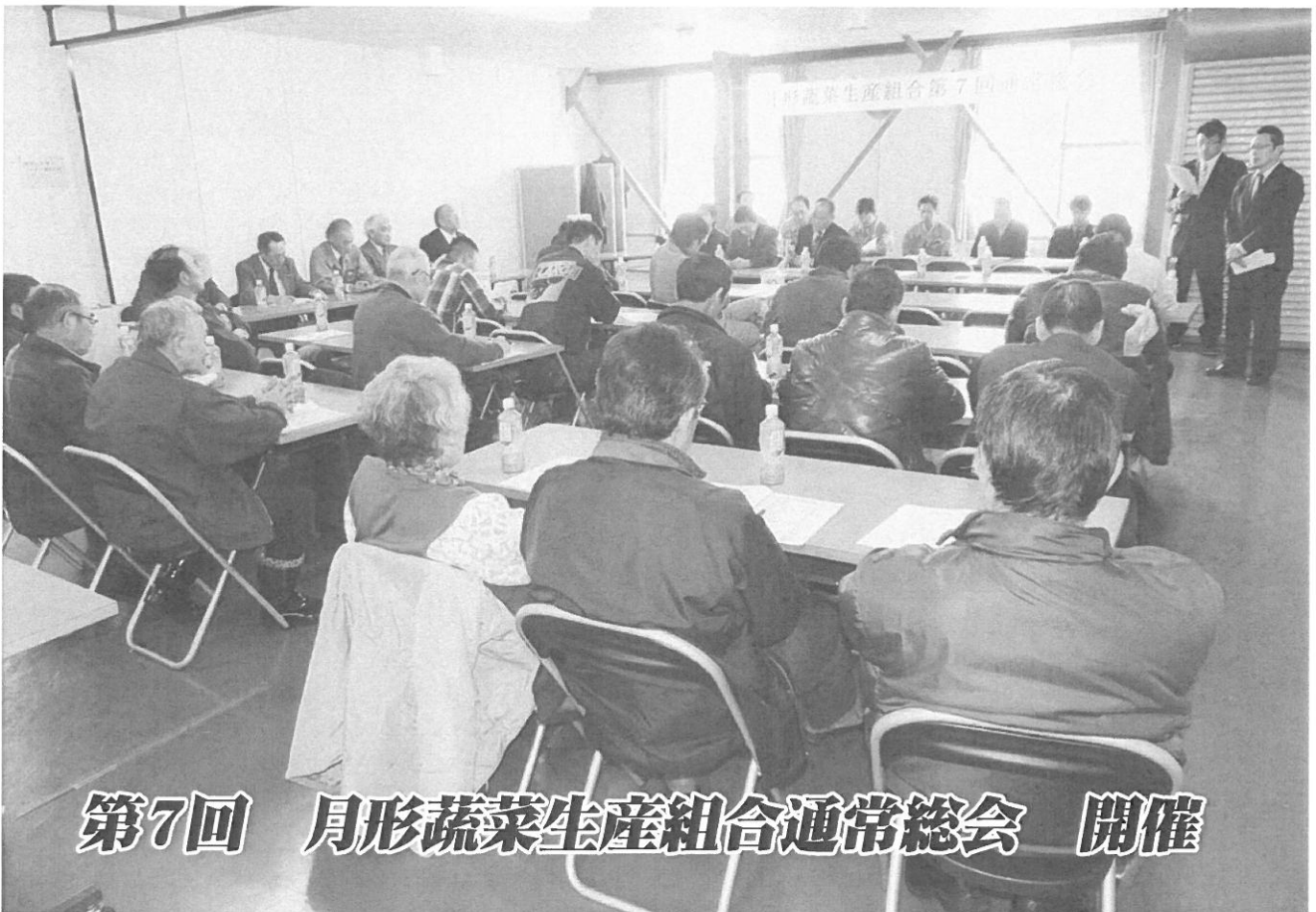
第7回 月形野菜生産組合通常総会 開催