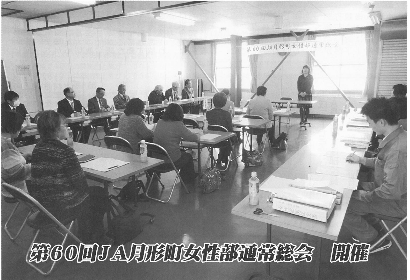
第60回JA月形町女性部通常総会 開催