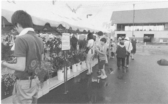
月形花き生産組合による町内で生産された切花展示は、多くの来場者に「月形の花」をPRしました。展示された花は販売され、売上金については月形町社会福祉協議会へ全額寄付されています。

7月25日(土)・26日(日)の2日間にわたり「第32回つきがた夏まつり」が月形町皆楽公園特設会場に於いて開催されました。