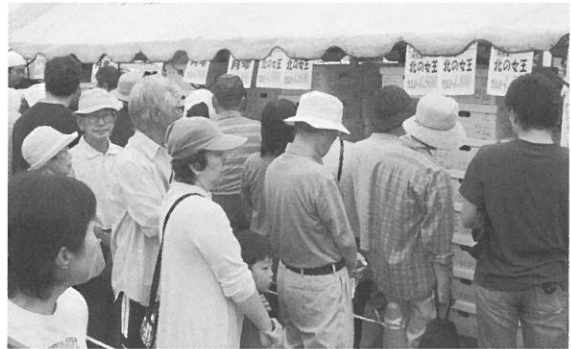
当日は時折雨の降るあいにくの空模様でしたが、JA職員総出で行われた農産物の即売会は、メロンなどを求める大勢のお客さんに囲まれ大盛況となりました。