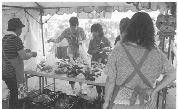
農協女性部は部員が作った野菜・花・手芸品などを販売し多くの方々に買い求め頂きました。売上金の一部は、月形町社会福祉協議会に寄付されています。