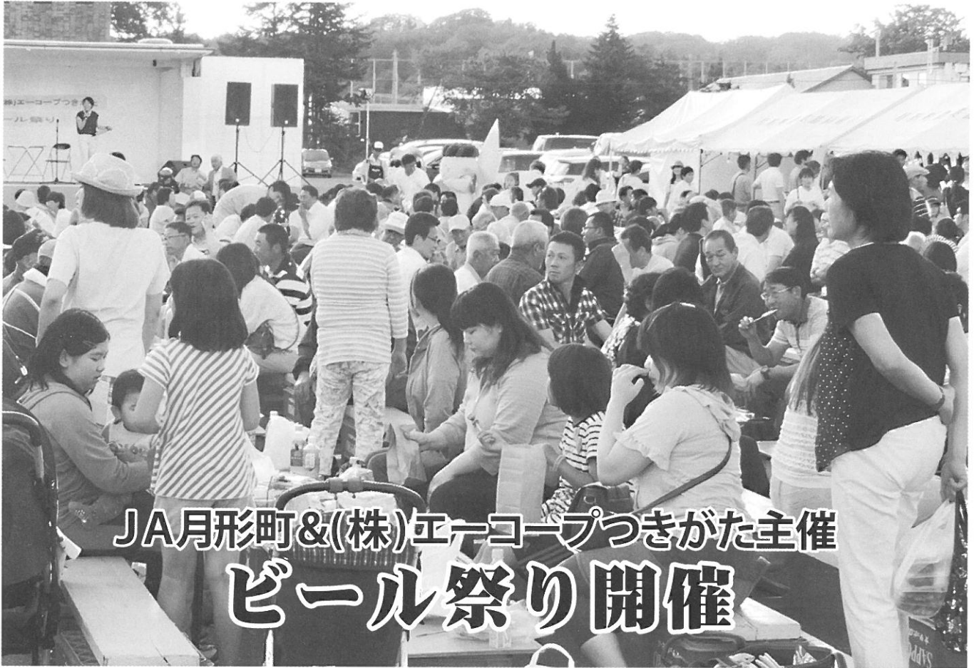
JA月形町&(株)エーコープつきがた主催 ビール祭り開催