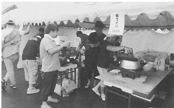
農協青年部は、2日間にわたり青年部特製焼きそば、生ビール、ネギ塩ダレ付牛タン焼を販売しました。