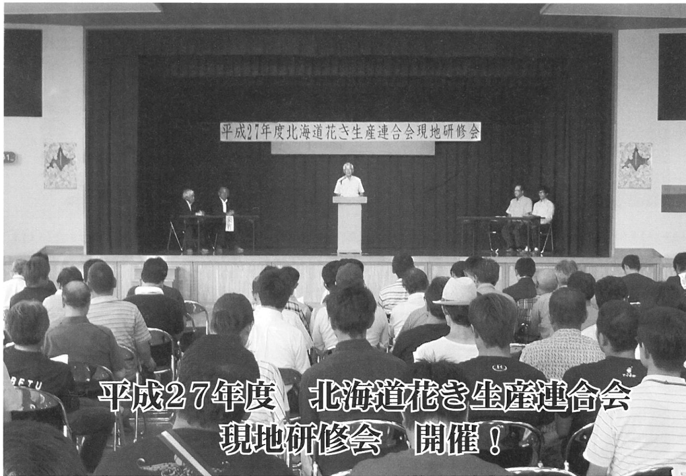
平成27年度 北海道花き生産連合会 現地研修会 開催!