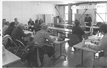
1月29日 月形ミニトマト生産組合 第6回通常総会