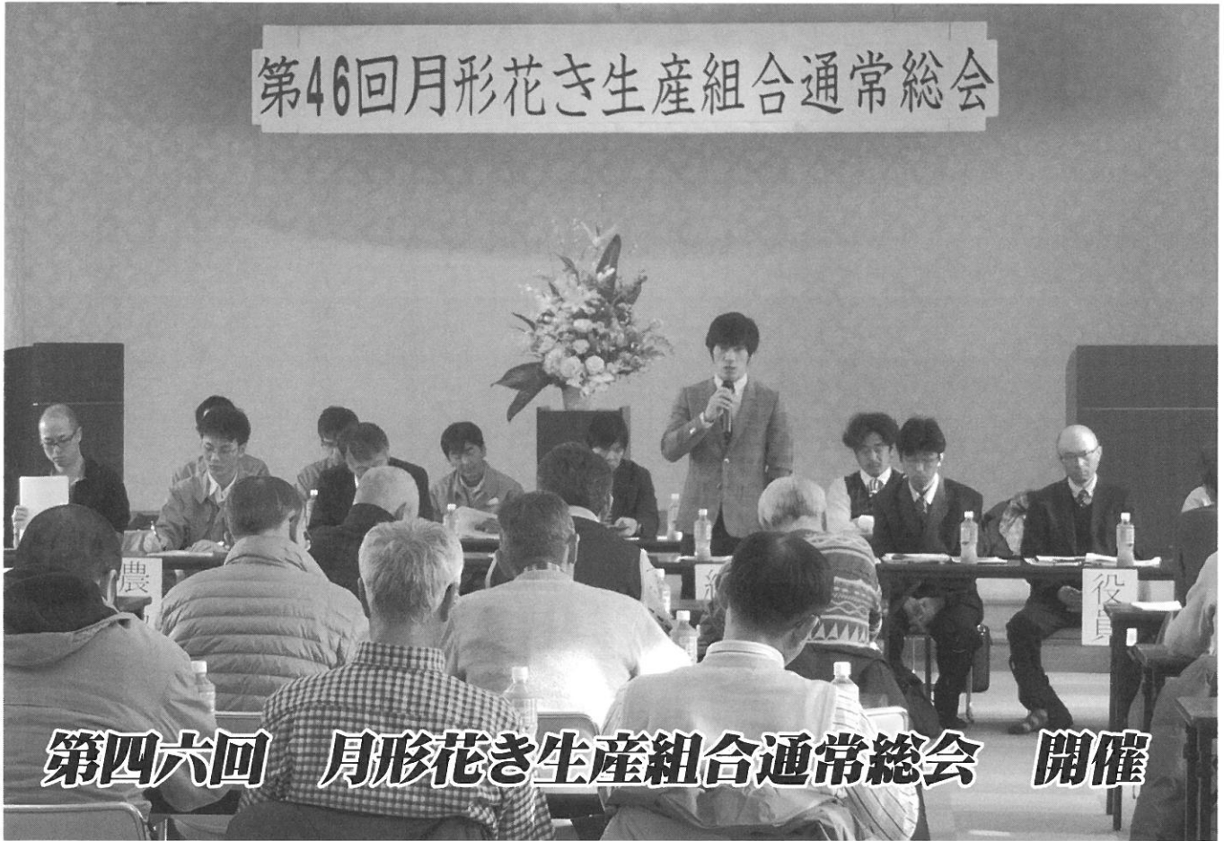
第四六回 月形花き生産組合通常総会 開催