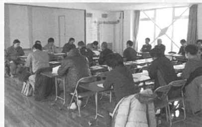
2月4日 月形新鮮組 第13回定期総会