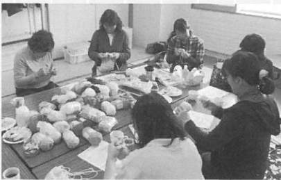
2月19日 JA月形町女性部 手芸教室開催