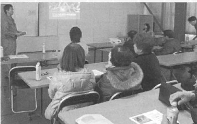
2月22日 ミニトマト栽培 講習会