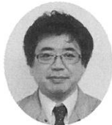
金融部長 西野 宏希