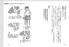
足の水分のふきとり方