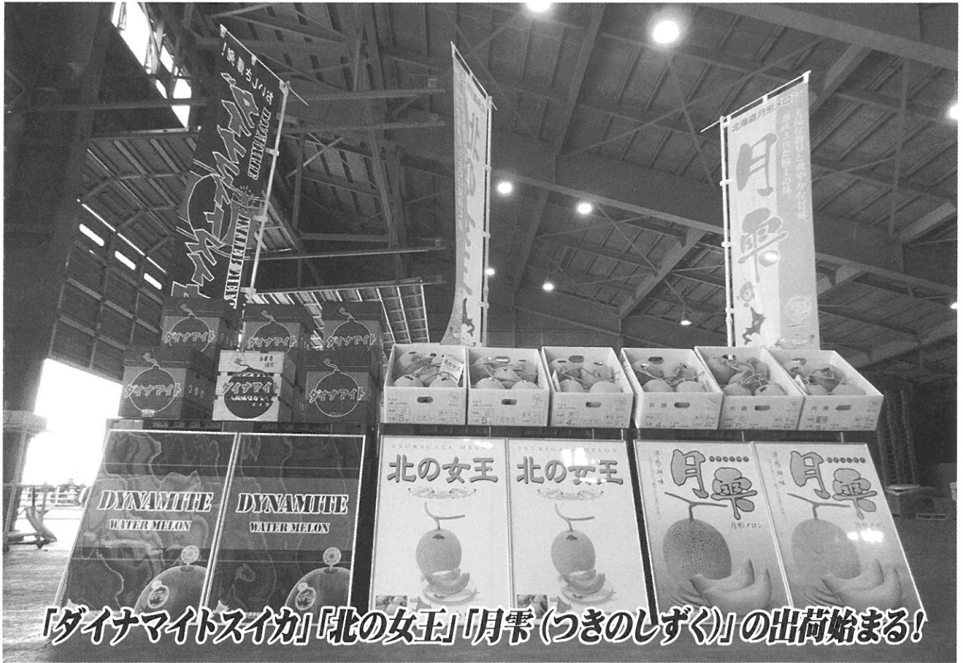
「ダイナマイトスイカ」「北の女王」「月形(つきのしずく)」の出荷始まる!