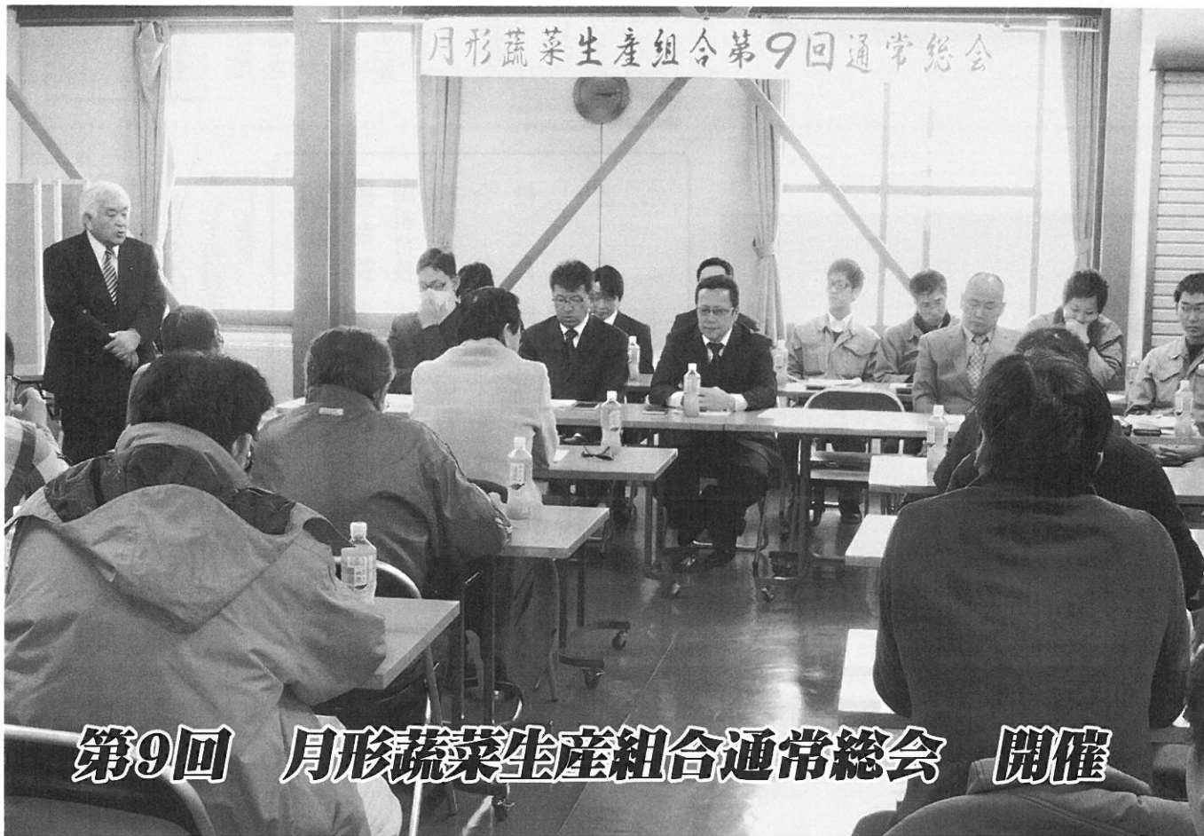
第9回 月形蔬菜生産組合通常総会 開催