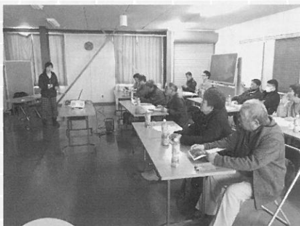
2月23日 ミニトマト 栽培講習会