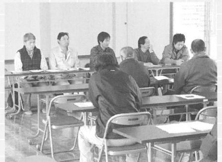
2月3日 月形新鮮組 第14回定期総会