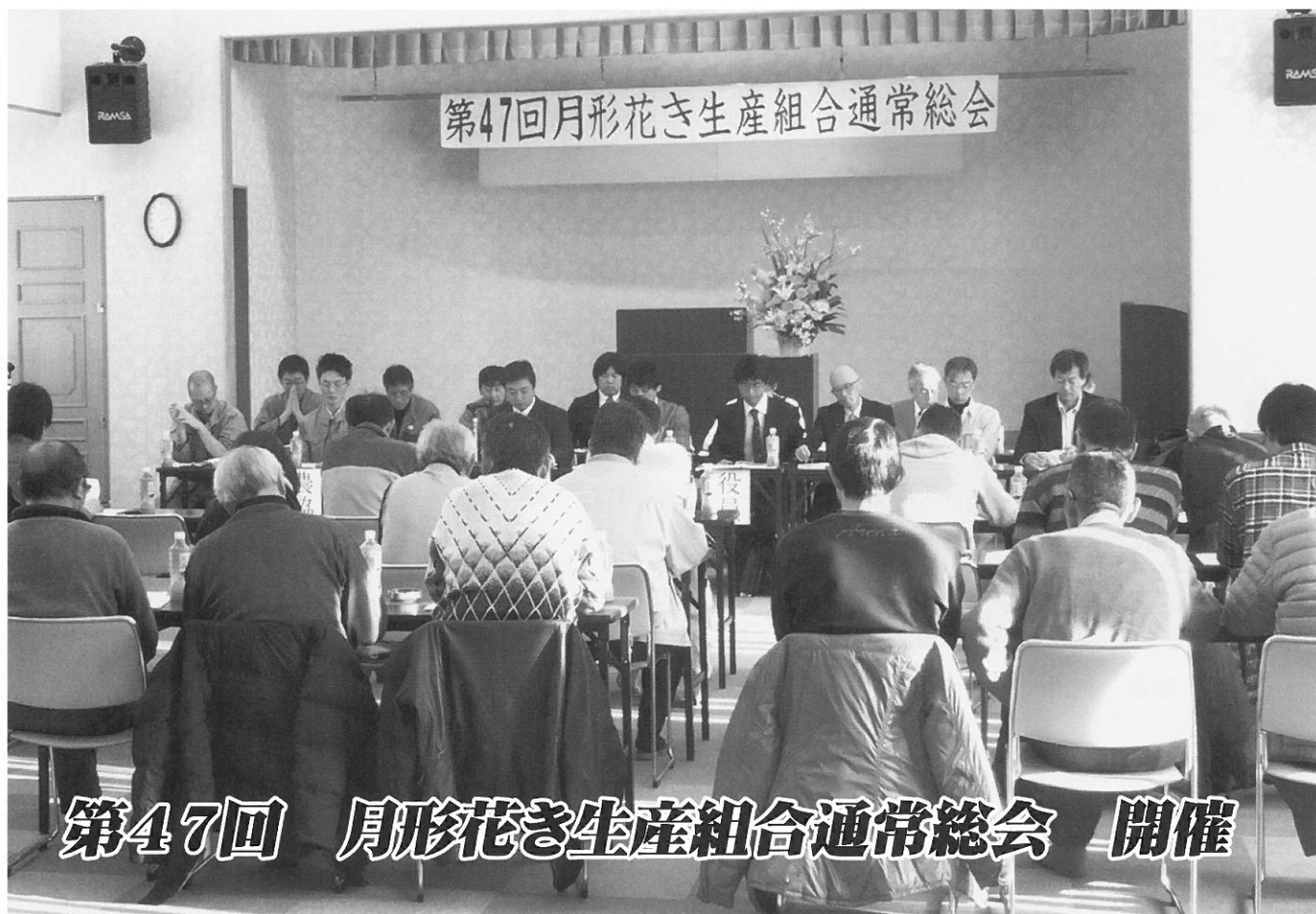
第47回 月形花き生産組合通常総会 開催