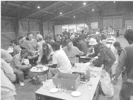
■六月二十四日 月形町蔬菜生産組合 流通懇談会が開催されました。