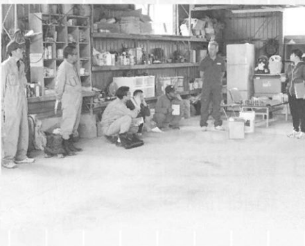
■六月二十六日 小麦・大豆生産組合の現地講習会が札内地区で開催されました。