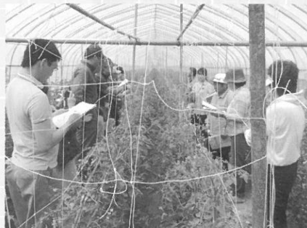
■六月十九日 月形ミニトマト生産組合の現地講習会が南耕地地区で開催されました。