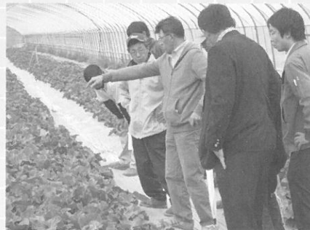
■六月十五日 月形町蔬菜生産組合の生産者がJAとまこまい追分地区を訪問、北海カシロの畑や撰果の様子を視察しました。