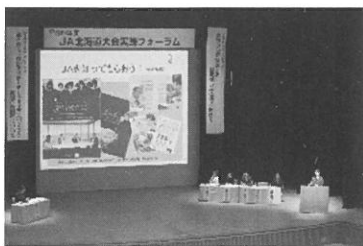
JAによる事例発表の様子↑

に札幌市で開催した「JA北海道大会実践フォーラム」では、JA北海道大会（平成二十七年開催）の決議事項の実践機運を高めること等を目的に、『新規担い手倍増』と『道民と食と農でつながるサポーター五百五十万人づくりと准組合員制度』をテーマに取り上げ、JAの実践事例発表とパネルディスカッションにより、『担い手受け入れへの地域合意形成』と『准組合員との関係強化』の大切さなどを再認識する場となりました。