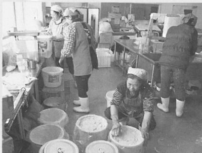
女性部 味噌づくり講習会