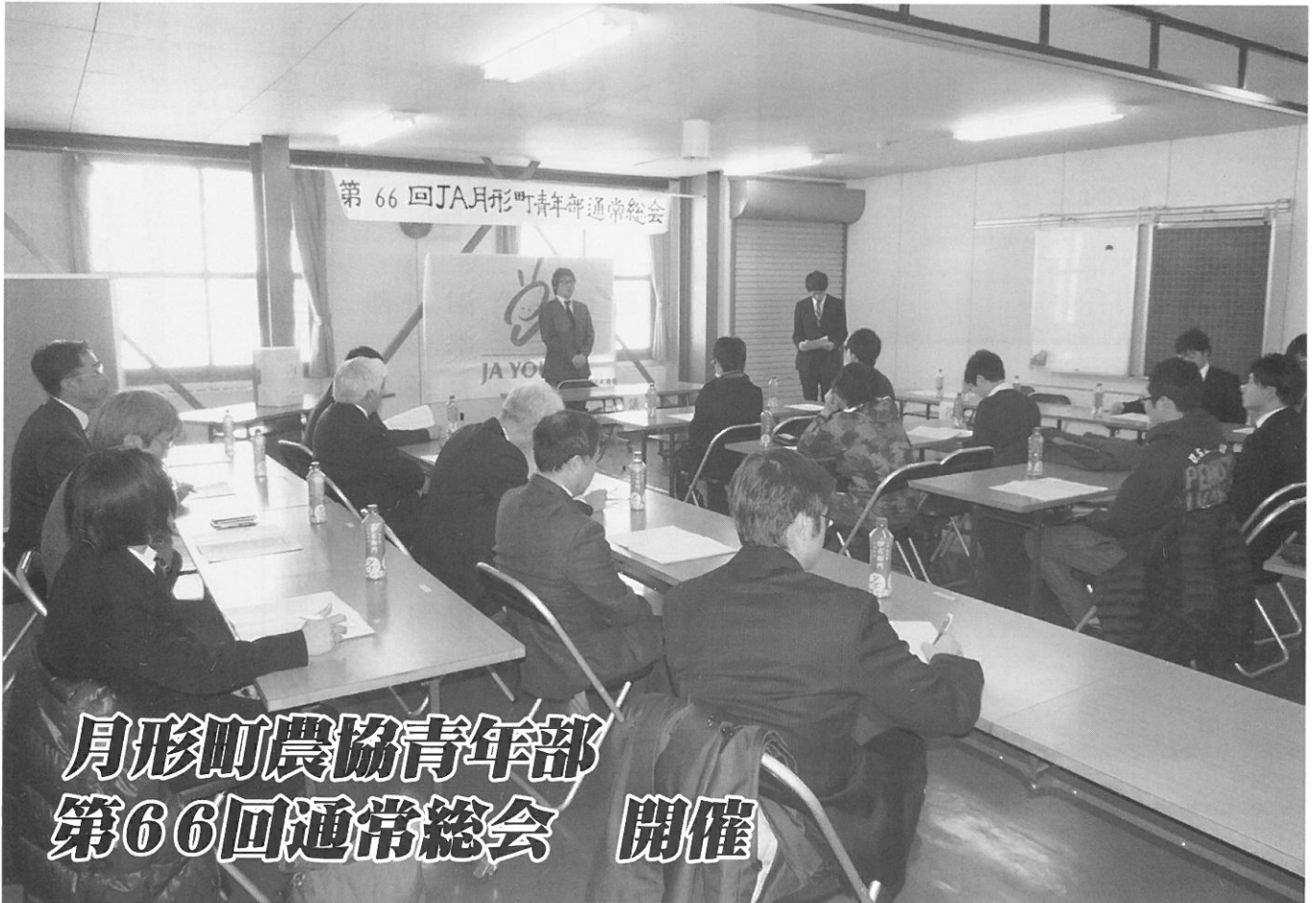
月形町農協青年部 第66回通常総会 開催