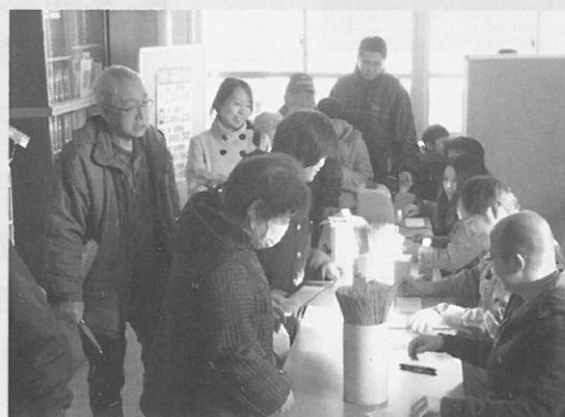
十二月三十日 ㈸エーコープつきがた 年末抽選会