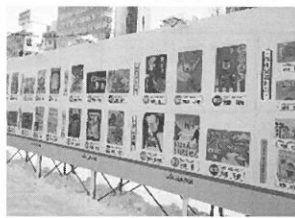
昨年の会場の様子↑

JAとJA共済連北海道は、交通ルールの大切さや交通安全に対する願いが描かれた小・中学生の皆さんの作品を通して、交通事故防止の意識づくりにつなげたいと考えています。