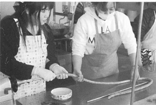
女性部 ワインナー作り講習会