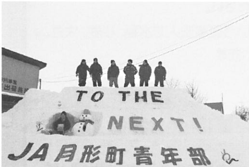
青年部 スノーメッセージ作成