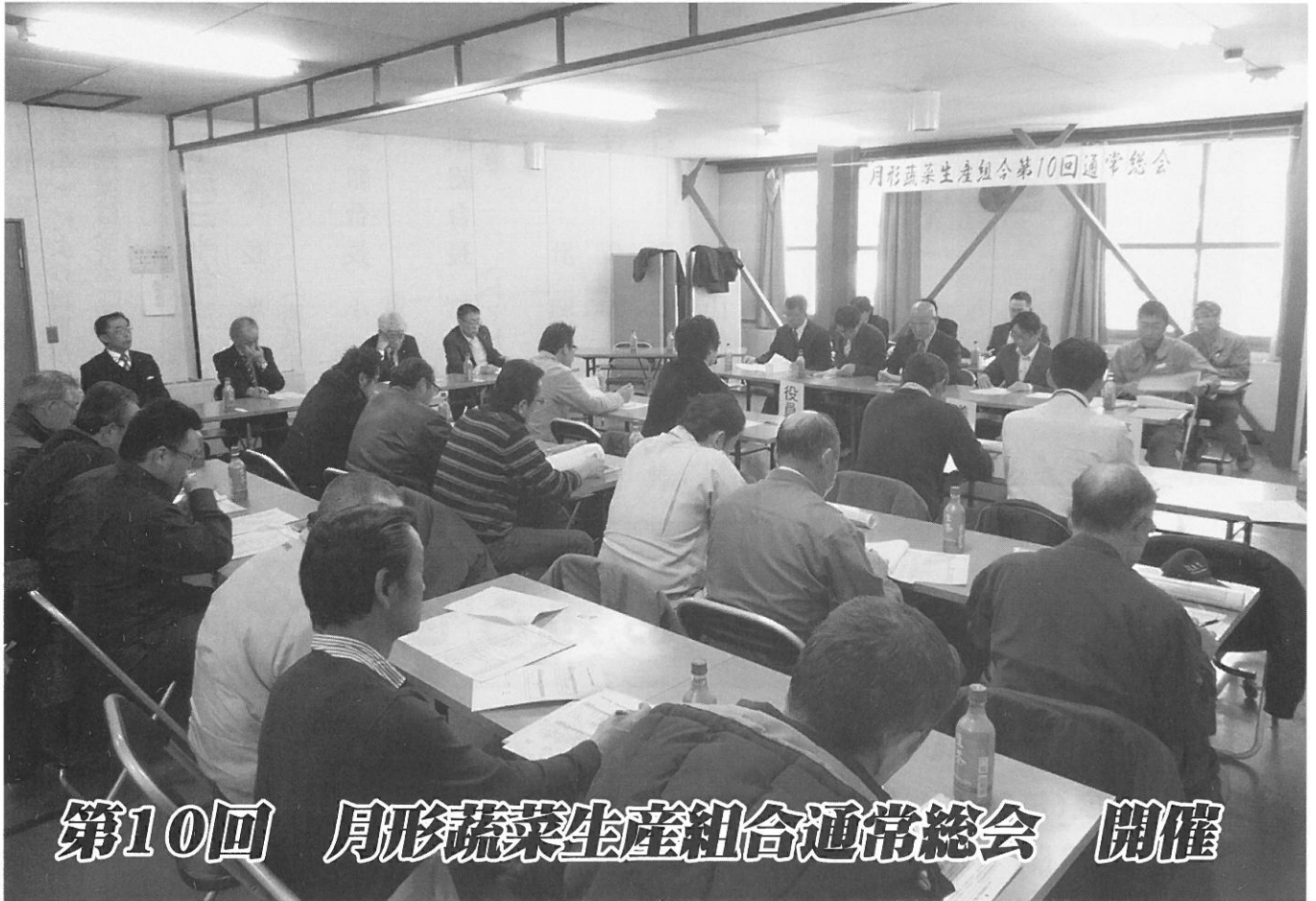
第10回 月形野菜生産組合通常総会 開催