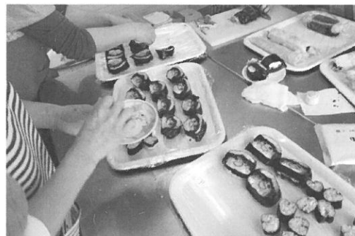
二月十五日 女性部 飾り巻き寿司講習会