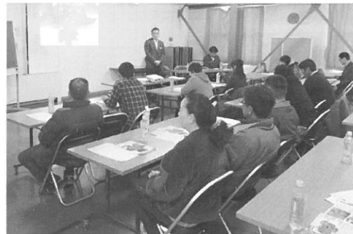
二月十四日 月形蔬菜生産組合 栽培講習会