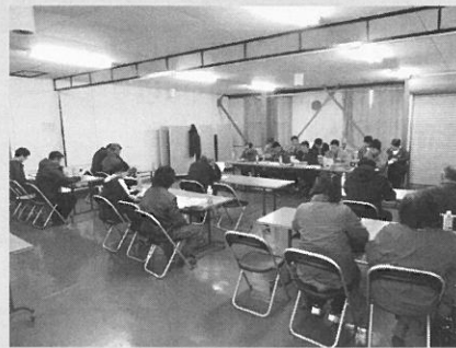
月形ミントマト生産組合 全体会議開催 (四月四日)

㈱クボタ三笠営業所にて作業機器のメンテナンスの講習及び㈱ロムより担当者を講師に迎え農耕地から発生する温室効果ガスの削減について勉強会を開催しました。