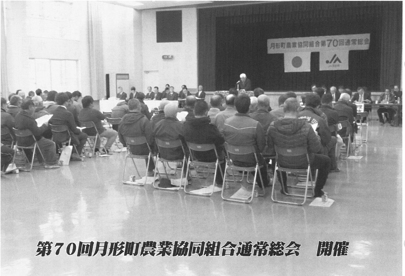
第70回月形町農業協同組合通常総会 開催