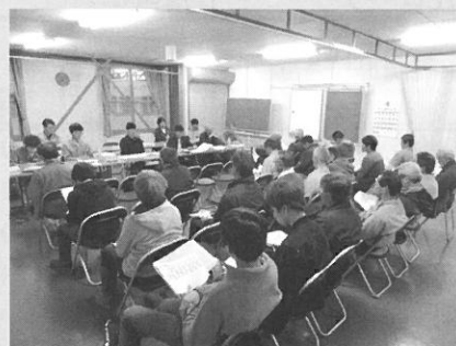
月形花き生産組合 全体会議開催 (四月十一日)