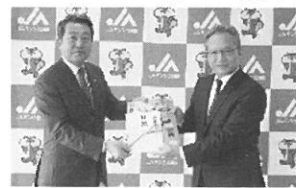
北海道教育委員会教育長へ贈呈

JAバンクでは、子どもたちが食と農業への理解を深めるきっかけとなることを願い、平成二十年度から、食農教育等をテーマとした教材本を製作し、JAを通じて道内の小学校へ贈呈しています。今年度は、全道一〇七九校の小学校および特別支援学校に贈呈します。 なお、本会からは北海道教育委員会へ教材本の贈呈を行い、教材活用への協力をお願いしました。