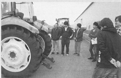
月形町農協青年部勉強会開催 (四月十七日)