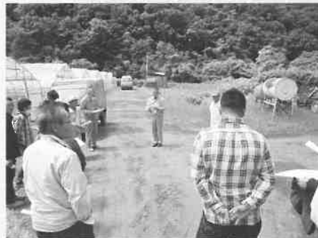
■六月十五日 月形ミニトマト生産組合が町 外視察研修で余市町を訪問 し、生産ほ場や選果施設を視 察しました。