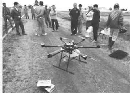
■六月八日 （有）フューチャリーのほ場で、 農業用ドローンのデモフラ イトが行われました。