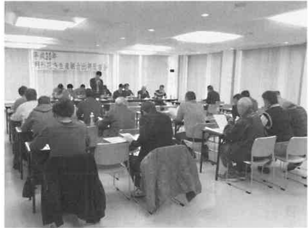
月形花き生産組合