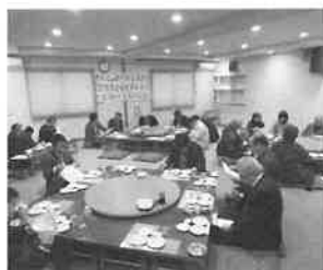
ミニトマト生産組合出荷反省会