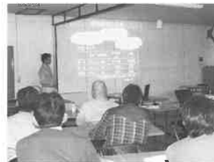
水稻栽培・転作関連技術講習会