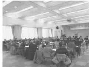
月形花き生産組合