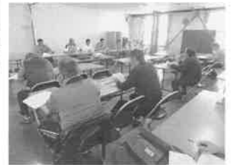
小麦・大豆生産組合通常総会