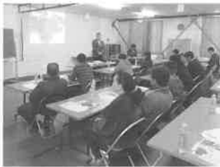
南瓜・メロン・トマト栽培講習会