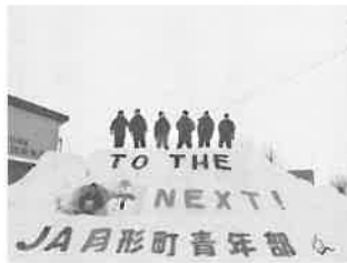
スノーメッセージ