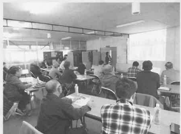
■11月28日 ミニトマト生産組合全体会議 ・栽培講習会