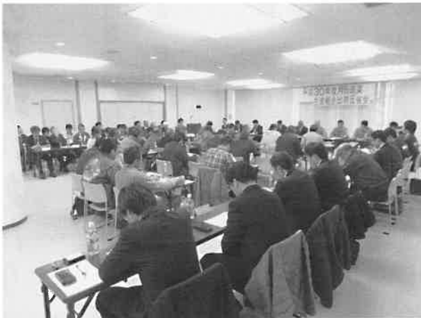
月形蔬菜生産組合

反省会では、JA担当者より本年度の出荷状況や販売額などが報告され、その後、生産者、市場・流通関係者、JA担当者を交えて意見交換が行われ、今年を締めくくりました。