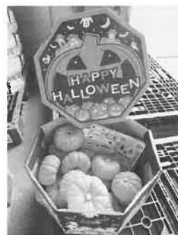
観賞用かぼちゃ 出荷