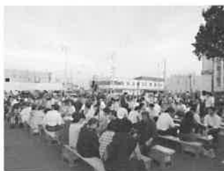
JA月形町& ㈱エコープつきがた ビール祭り