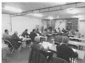
花き生産組合五部会反省会