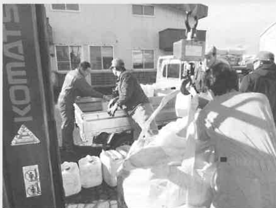
■11月2日 青年部農薬容器回収