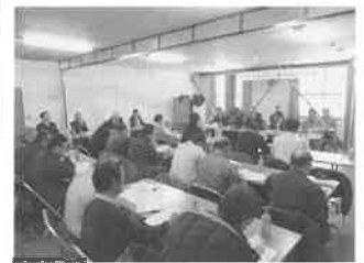
月形蔬菜生産組合