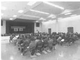
会場 多目的研修センター