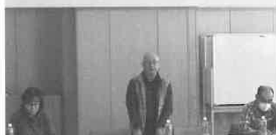
2月25日 JA月形町年金友の会 第3回通常総会