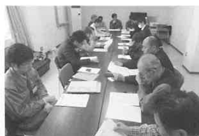
2月1日 月形新鮮組 第16回定期総会