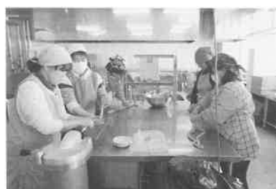
2月21日 女性部 ウイナー作り講習会