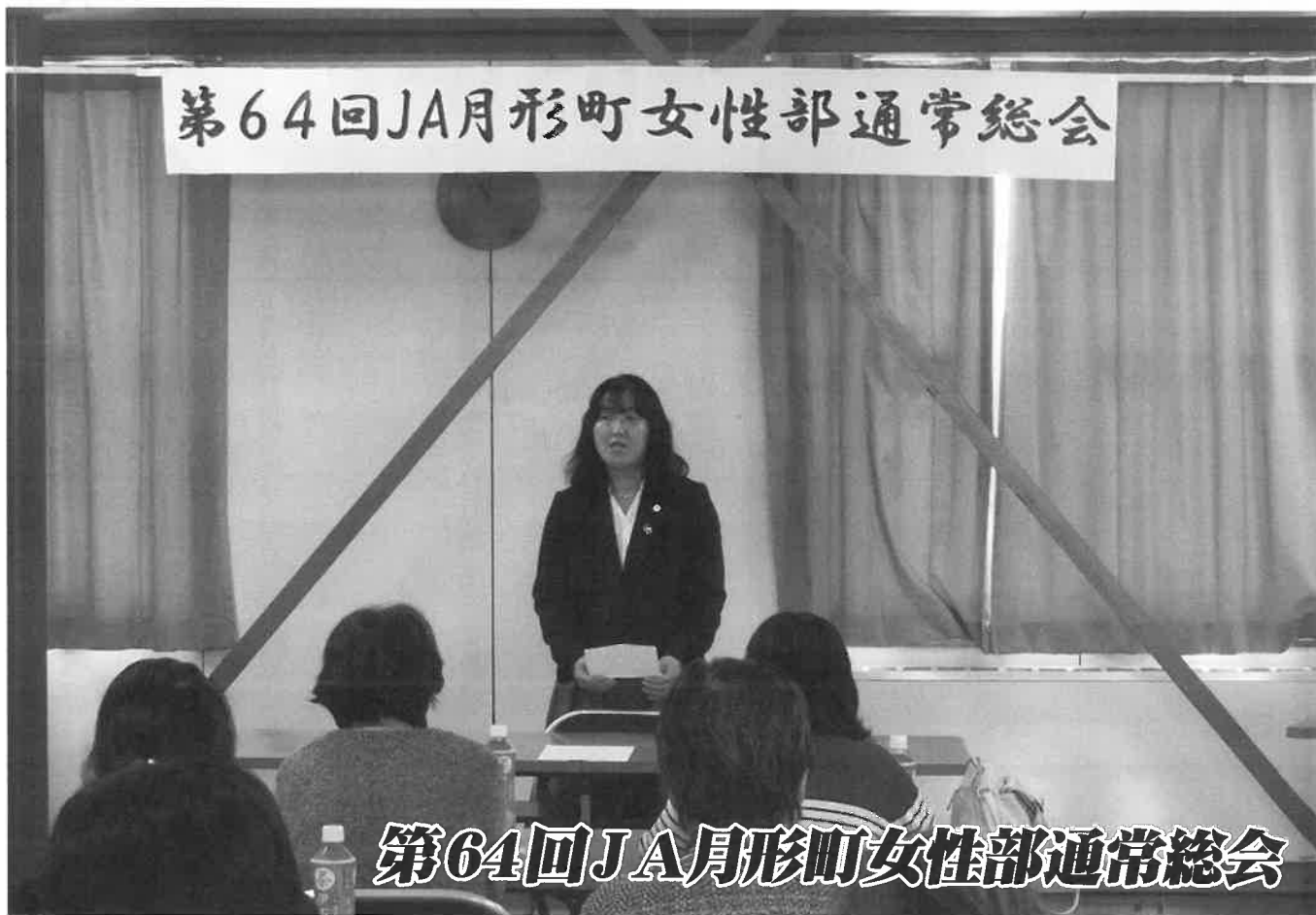
第64回JA月形町女性部通常総会