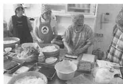
2月18日 女性部 のり巻き講習会