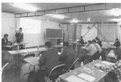
2月13日 月形蔬菜生産組合 栽培講習会