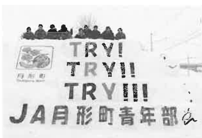
2月11日 青年部 スノーマッセージ作成