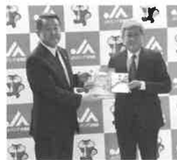
北海道教育委員会 教育長(写真右)へ贈呈