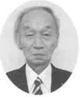
新代表理事組合長