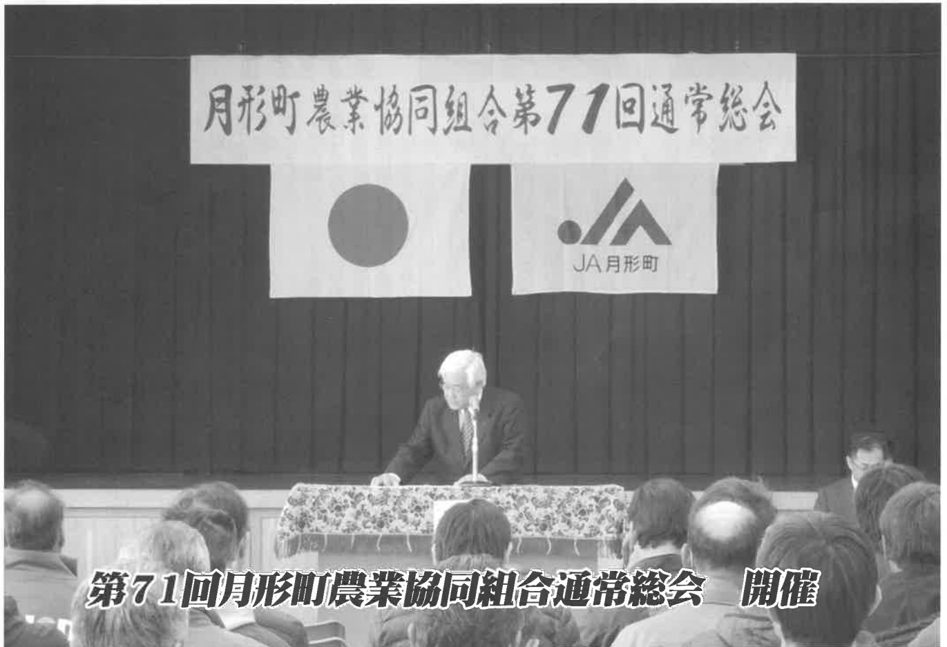
第71回月形町農業協同組合通常総会 開催