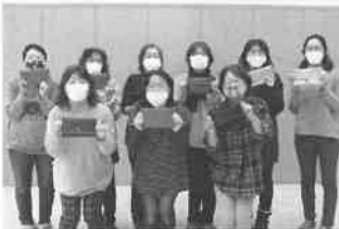
J A月形町女性部 マスクケース作り