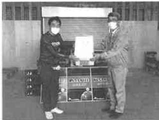
ダイナマイトスイカ初出荷