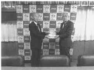
月形町教育委員会へ 食農教育教材寄贈