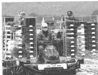
令和2年産米の田植え開始