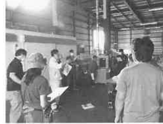
ミニトマト目慣らし