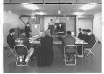
月形町農民連盟通常総会