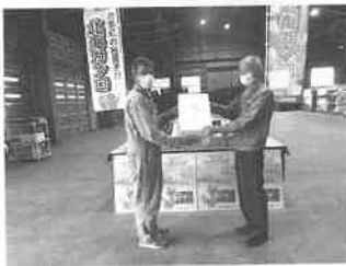
北海カン口初出荷