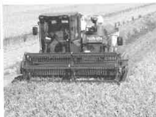
令和2年産米収穫作業