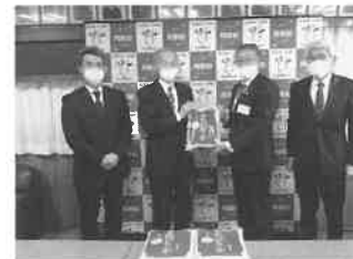
月形町教育委員会へ 学校給食用の米寄贈