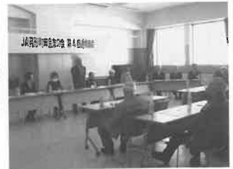
年金友の会通常総会