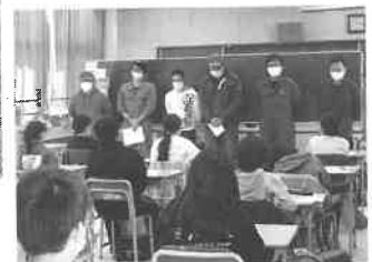
月形町農協青年部食農教育事業