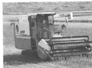
令和2年産大豆収穫作業