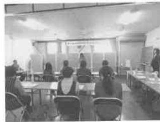
JA月形町女性部通常総会