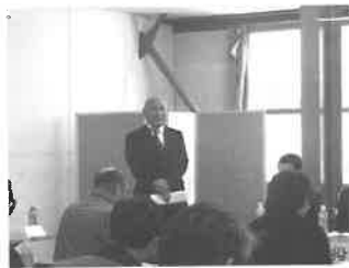
月形蔬菜生産組合通常総会