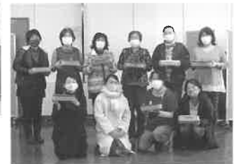
クラフトバンドで カトラリーケース作成

どうぞ輝かしい新春をJ A共済・J Aバンクと共に迎えてみてはいかがでしょうか。 みなさまのご来店をお待ち申し上げます。