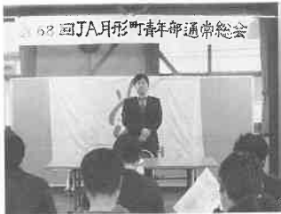
月形町農協青年部通常総会