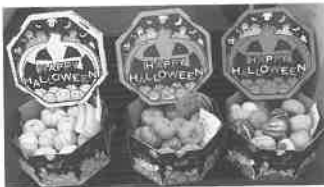
鑑賞用かぼちゃ出荷