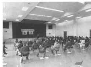
月形町農業協同組合通常総会