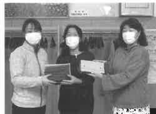
月形町社会福祉協議会へ寄贈