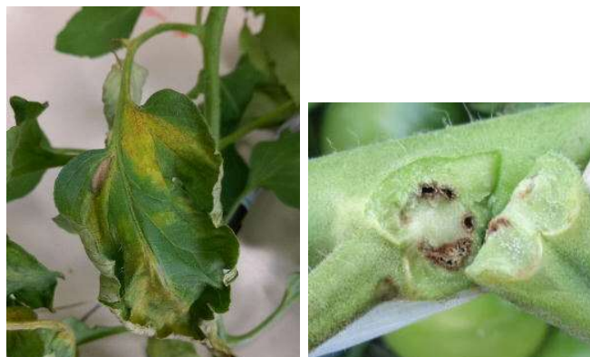
写真2 かいよう病の症状

アブラムシ類、アザミウマ類、ヨトウガの被害が拡大すると、秋季の収量が大きく低下するため、適切な防除を行う。また、オオタバコガ成虫の飛来時期となるため、幼虫の食害に注意する。