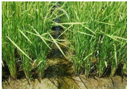
写真1 出穂後の溝切り