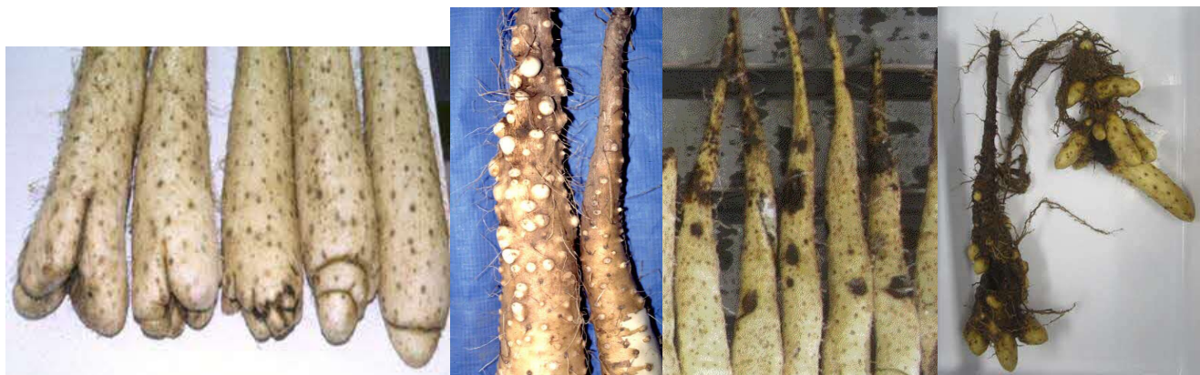
写真2 排水不良による尻部のコブ 写真3 滞水による首部の突起 写真4 根腐病 写真5 褐色腐敗病(崩壊型)

春掘りほ場では、茎葉及びネット、マルチ残さ等で畝上を被覆し、土壌凍結の軽減により腐敗防止を図る。