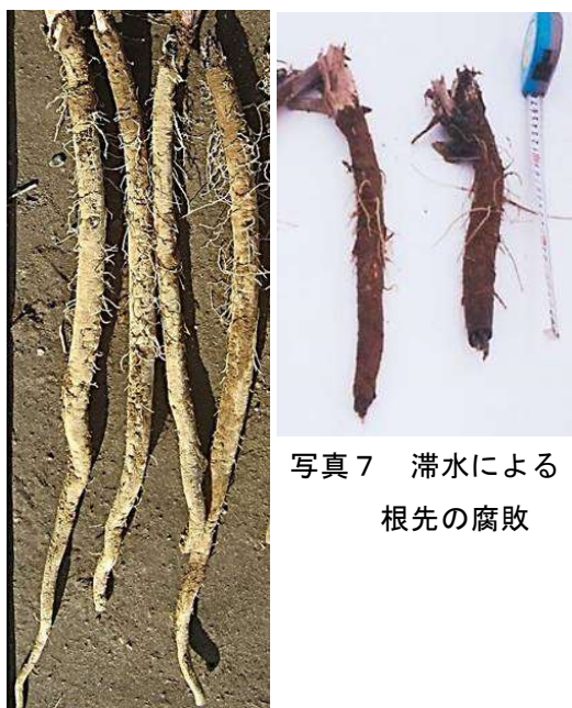
写真7 滞水による根先の腐敗

掘り取り後は、根先のしおれによる品傷みを防ぐため、コンテナに内包資材を充て品質を保持する。