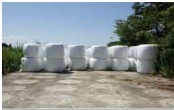
写真2 ロールベールの縦積み保管、越冬前に破損の点検を