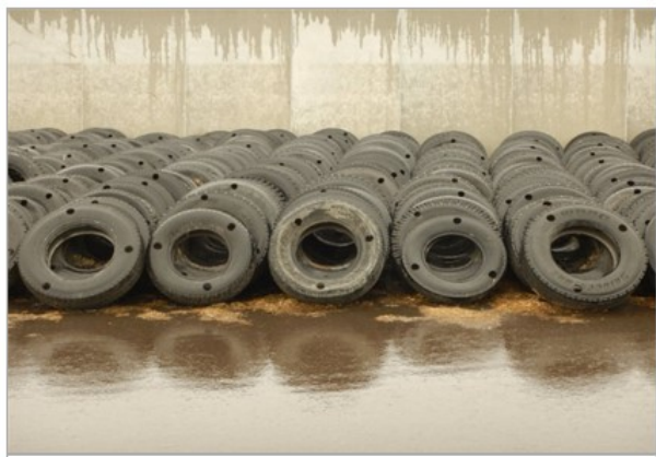
写真1 整理整頓されたサイロ周辺のタイヤ