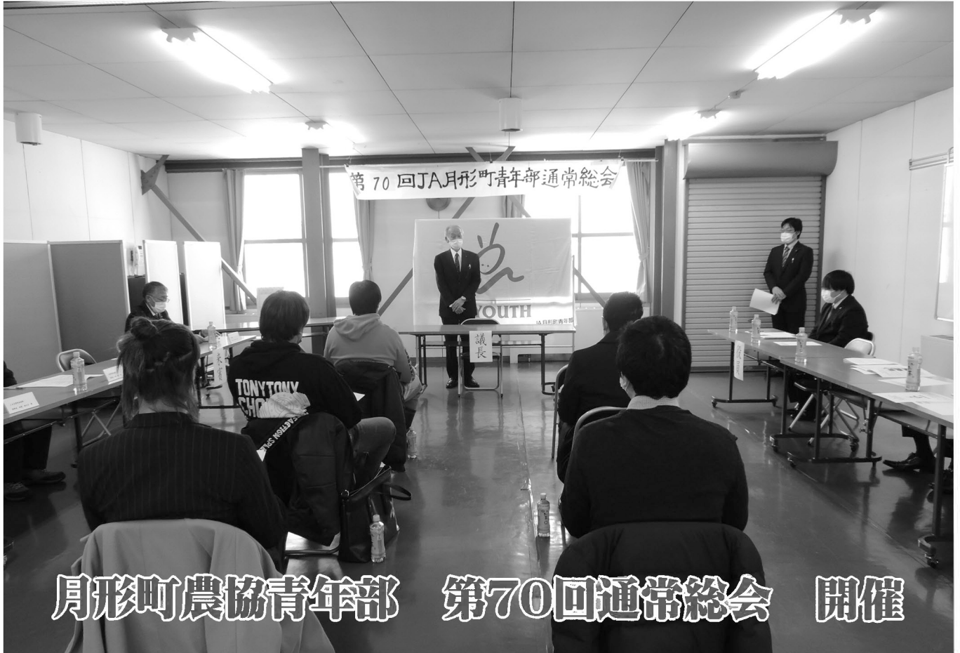
月形町農協青年部 第70回通常総会 開催