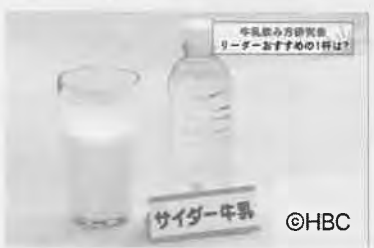
オススメの割合はサイダー3：牛乳7