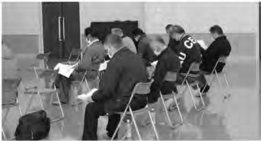
多目的研修センター

3月10日、11日、地区別懇談会が開催され、令和3年度農協事業の実績概要及び令和4年度農協事業の計画概要書などについて説明致しました。 出席された組合員の皆様のご意見を、今後のJA事業に活かしてまいります。