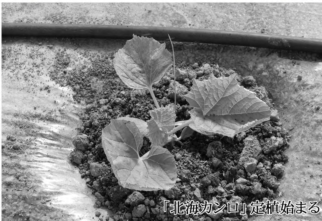
「北海カンロ」定植始まる