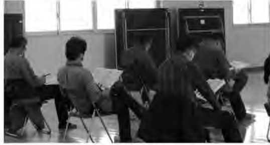
札比内コミュニティーセンター