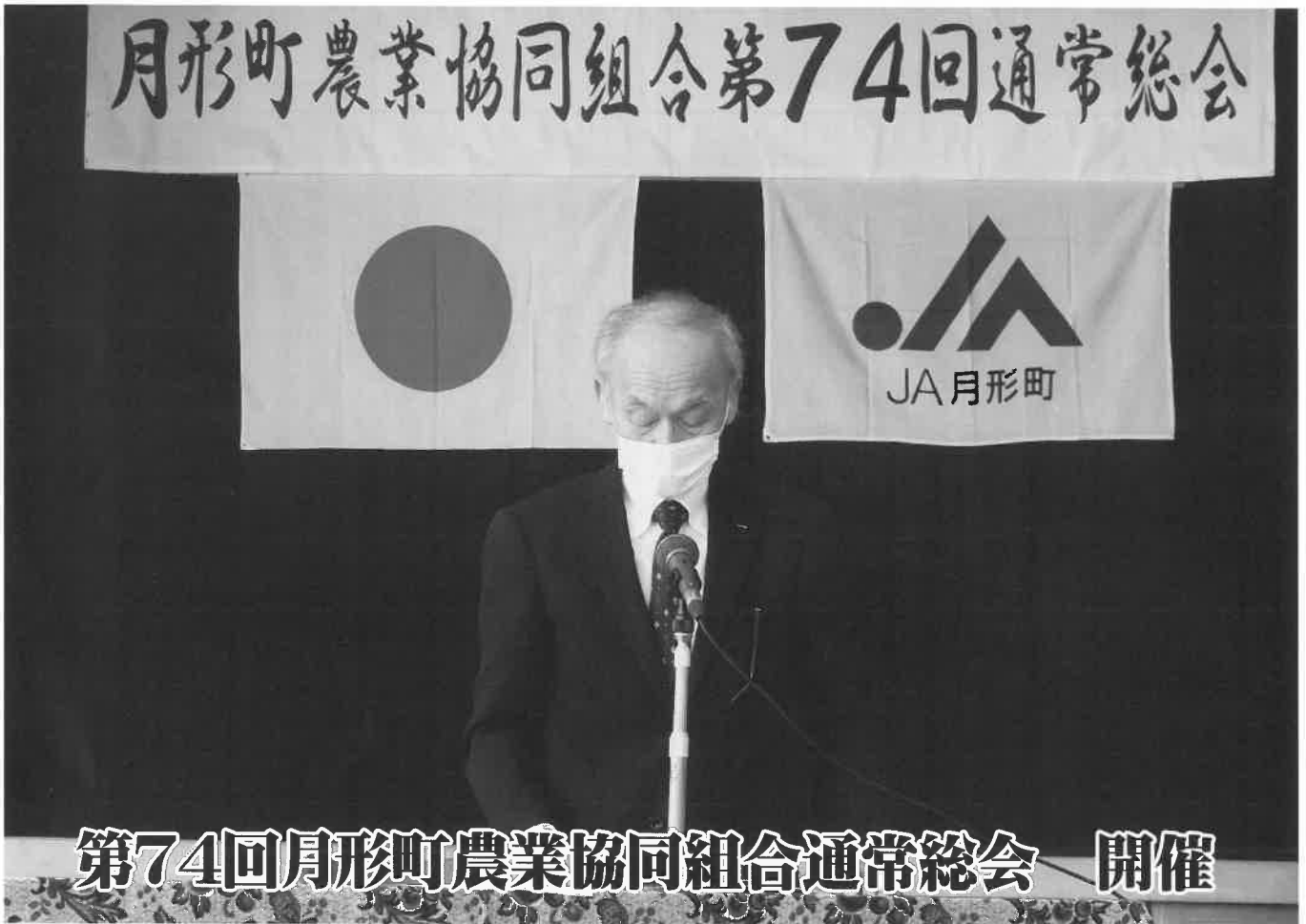
第74回月形町農業協同組合通常総会 開催