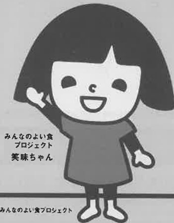
みんなのよい食 プロジェクト 笑味ちゃん