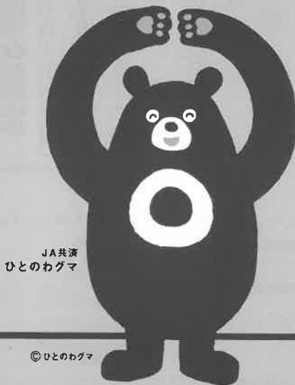
JA共済 ひとのわぐま

お客様の大切な現金等重要物をお預かりする際は、受取書・領収書等を必ずお渡ししております。