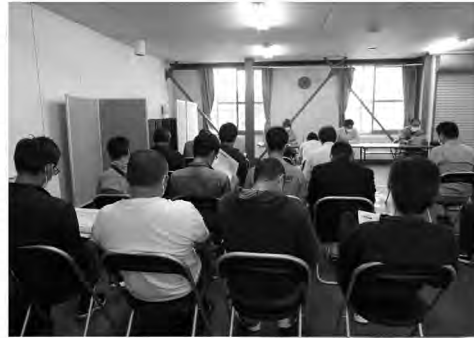
肥料価格高騰対策事業説明会が2部制で開催され、多くの組合員が参加されました。