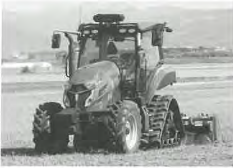
札比内地区の圃場にてロボットトラクターの実演がありました。