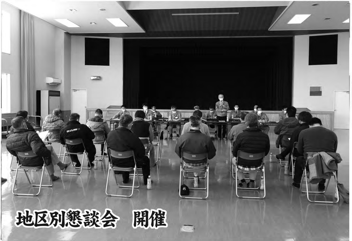
地区別懇談会 開催