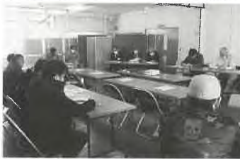
月形小麦・大豆生産組合 通常総会及び栽培講習会