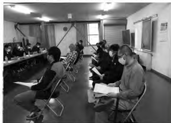
月形蔬菜生産組合全体会議