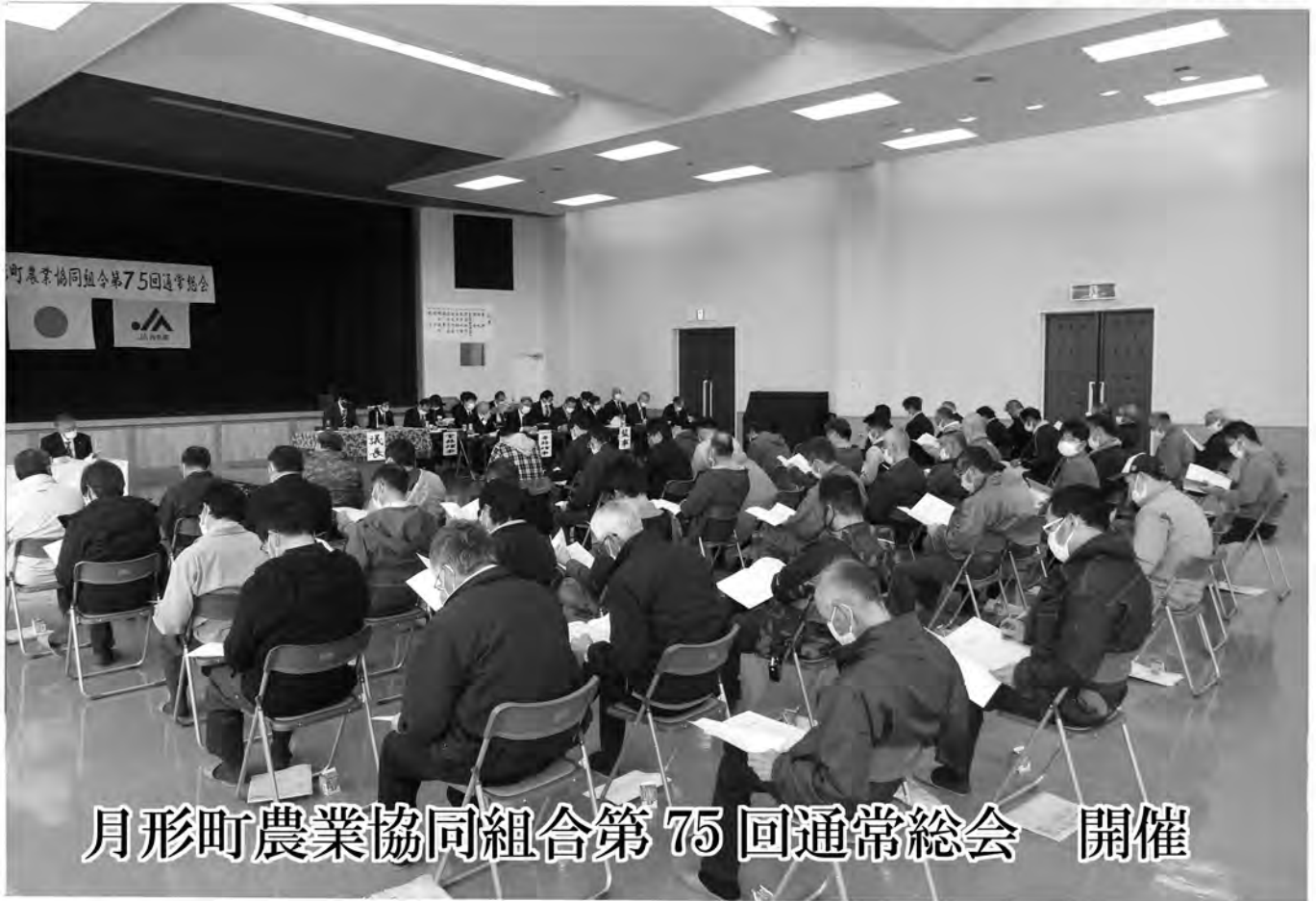
月形町農業協同組合第75回通常総会 開催