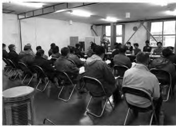
月形花き生産組合全体会議