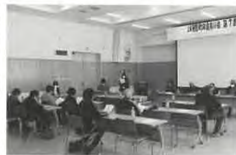
JA月形町年金友の会 第7回通常総会