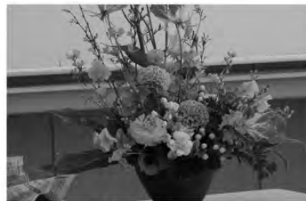
月形花き生産組合 フラワーアレンジメント講習会