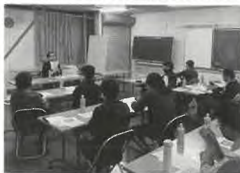
月形花き生産組合切り花講習会