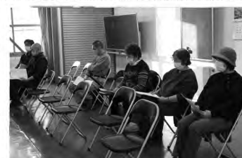
月形ミニトマト生産組合 全体会議