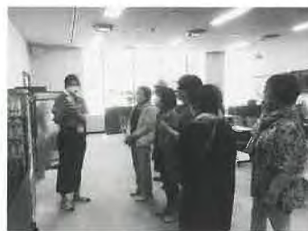
年金友の会研修旅行