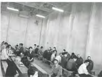
蔬菜組合流通懇談会