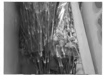
楊貴妃目揃い及び検討会