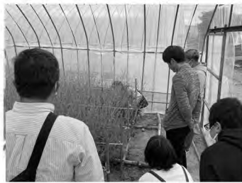
花き青年部町外視察