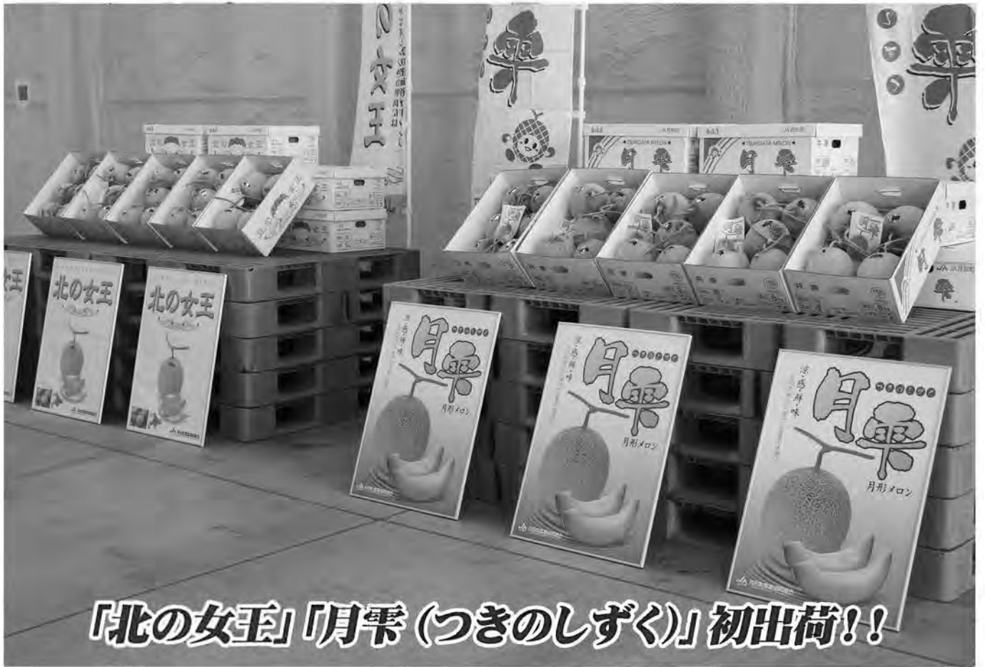
「北の女王」「月形 (つきのしずく)」初出荷!!