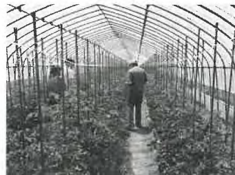
ミニトマト町外視察