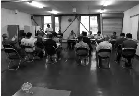
こめ工房運営委員会