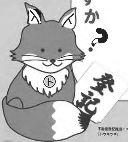
不動産登記推進イメージキャラクター 「ドウスンネ」

法務省民事局 MINISTRY OF JUSTICE CIVIL AFFAIRS BUREAU