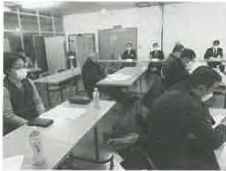
ミニトマト 組合総会