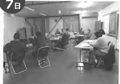
JA北海道大会フォーラムWEB開催