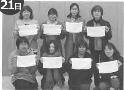
女性部地域貢献活動（雑巾作り）