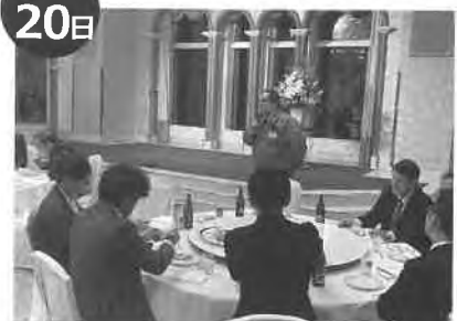
北海道花き生産流通セミナー