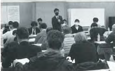
月形花き生産組合