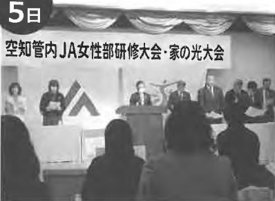
空知管内JA女性部研修大会・家の光大会