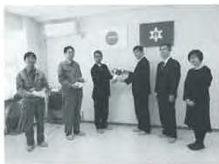
令和5年月形花き生産組合出荷反省会