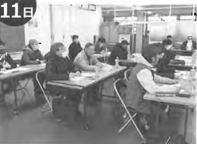
月形花き生産組合カーネーション部会 出荷反省会