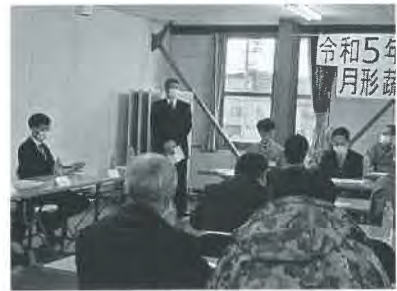
月形野菜生産組合