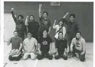
優勝を喜ぶ青年部員