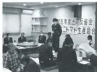
ミニトマト反省会