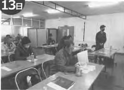
月形花き生産組合UVBライト講習会