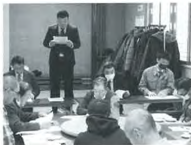
月形ミニトマト生産組合