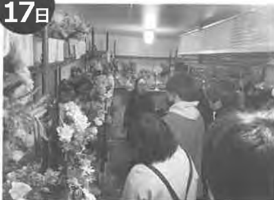
月形花き生産組合青年部出荷反省会