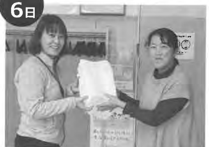
女性部 月形町社会福祉協議会へ雑巾寄贈