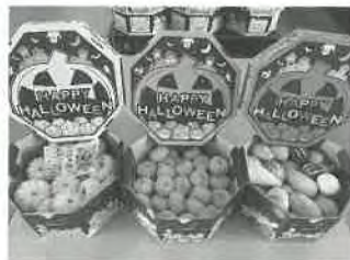
左から『ブッチーニ』『JBクイック』 『フルーツMIX』