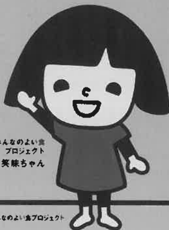
みんなのよいま プロジェクト 笑顔ちゃん