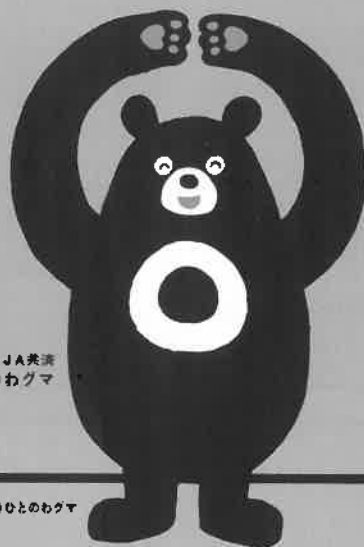
JA共済 ひとのわぐま

お客様の大切な現金等重要物をお預かりする際は、受取書・領収書等を必ずお渡ししております。