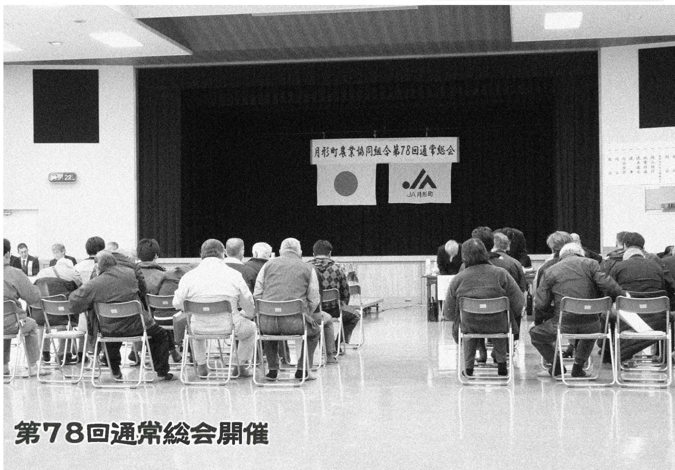
第78回通常総会開催